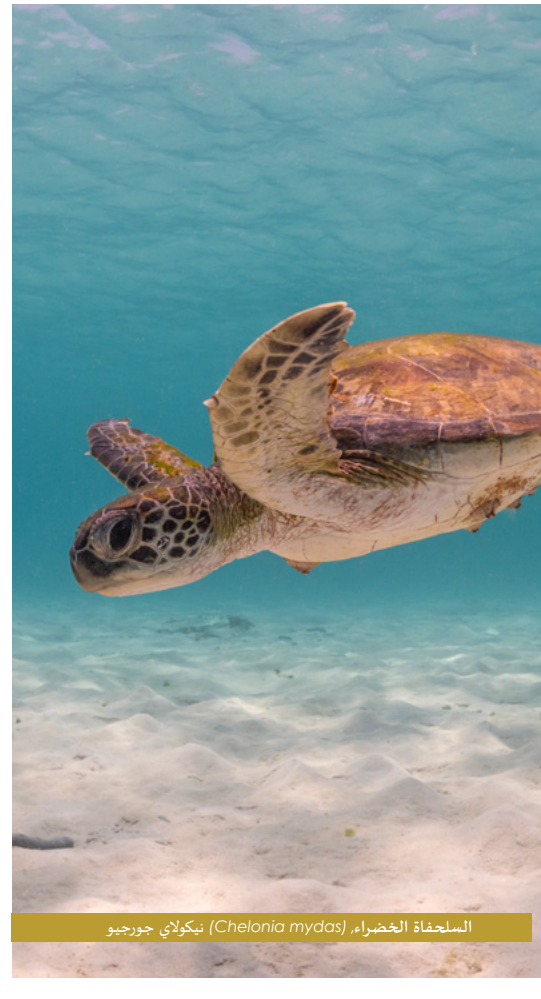
السفحة الخضراء (Chelonia mydas) سوكاي جريسيو

واصل فريق جمعية البيئة العمانية الميداني مسوحاته السنوية حول السلاحف البحرية في جزيرة مصيرة، وذلك خلال فترة التعشيش ما بين شهري مايو وسبتمبر، كما جرى على شاطئ هذه المسوحات عمليات إنقاذ السلاحف مما تعرضت له سواء إناث صلت طرفها عن مياه البحر، أو المقلوبة على صفيحتها أو العالقة ضمن مواد التوعية من أجل إصلاها أيضاً إلى رصيدها من الصون التوعوية من خلال إطلاق الكتيب التوعبي «السلاحف والأطفال المعشقة في عمان»، وكتيب الأنشطة للأطفال «السلاحف البحرية في عمان»، اللذين يكملان الرسم البياني الذي صدر مؤخراً «السلاحف البحرية المعشقة في مصيرة»، يمكن الطلاب على النسخ الإكتروني للمجموعات التعليمية للجمعية على الموقع الإلكتروني للجمعية لتقديم الحياة الفطرية والثروة السمكية على تمويل المشروع وتمكيننا من تنفيذ هذه المرحلة