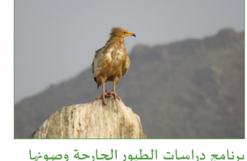
برنامج دراسات الطيور الجارحة وصونها