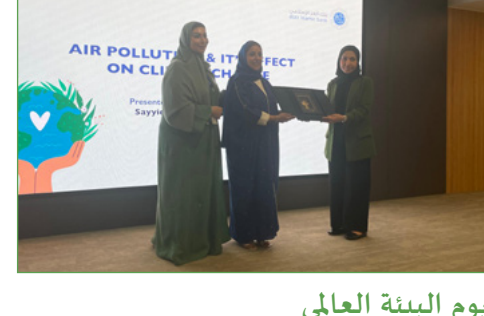
يوم البيئة العالمي

أبنت الجمعية بنجاح كبير مرحلة الزيارات المدرسية والتقييم البيئي ضمن مسابقة نمتظ للدراس الحكومية، والتي شملت ١١ مدرسة من ٩ محافظات، واستمرت لمدة ٦ أيام. تبنت المدارس المشاركة محور المسابقة، وقامت بتطبيقها على المدارس والمجتمع المحيط بغية تخليص المجتمع من المواد البلاستيكية أحادية الاستعمال واستبدالها بحلول مستدامة. كما قامت بعض المدارس بمعالجة المياه الرمادية، والاستفادة من طاقة الشمس والزرايح لتشغيل محطات الضخ، وحرصت المدارس المشاركة للتمرة الثانية على استدامة مشاريعها السابقة وتشجيع الطلاب على الابتكار وزيادة الأعمال، جرى اختيار ٦ مدارس فائزة هي: مدرسة جمال بن خميس، ومدرسة الأزهر بن محمد الأزكوي، ومدرسة صبيح بن خميس، والأهل للصوم، ومدرسة أم ذر الغفاري، ومدرسة وادع بن عمر، ٣ منها فقط هي المدارس الفائزة والتي سوف تلقى جوائز تشجيعية تكريماً لجهودهم التي قاموا بها. تدير الجمعية عن امتناتها العميق لمشروعها فويليا عمان ووزارة التربية والتعليم لدعمهم المستمر لهذه المسابقة، نتطلع معهم إلى تنظيم الحفل وإعلان الفائزين خلال شهر سبتمبر القادم بإذن الله تعالى