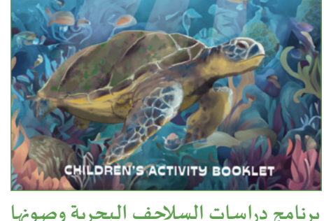
برنامج دراسات السلاحف البحرية وصونها

جرى خلال شهر يونيو من عام ٢٠٢٤ تنفيذ ٧ أيام من المسوحات الميدانية في جزيرة مصيرة حول طيور البهامات المهاجرة، ويتم حالياً معالجة وتحليل البيانات التي جرى جمعها، بغية تقييم وتحديد التغيرات في أعداد الأزواج في حدود المنطقة الجغرافية، وتحديد النسبة ما بين الطيور البالغة والغير متكاثرين بين العزرايا، ومعرفة العدد الطبيعي للطيور، وبالتالي تحديد احتياجات الصون لها، وإن جمعية البيئة العمانية تقدم بالشكر لشركة النهضة للخدمات على تمويل المشروع وتمكين الجمعية من تنفيذه