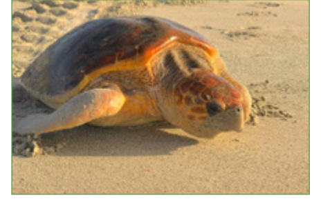
مشروع أبحاث وصون السلاحف البحرية لجمعية البيئة العمانية

تواصل جهودنا في مجال صون النسور الأذنة في عمان، ويواصل فريقنا مراقبة تواجد هذه النسور وحالات تكاثرها والتحديدات المحتملة التي تواجهها هذه الأنواع المهتدة بالانقراض، بالإضافة إلى تقديم مبادرات التوعية المجتمعية للزيادة الوعي، وأول مرة في عمان، قام فريق الخبراء لدينا بتكريب الحفلات وأجهزة التتبع عبر الأقمار الصناعية الربعة نسور أذنة. ميسم لنا بمراقبة تحركاتهم، مع معرفة المناطق التي يزورونها للتغذية والنشاط وكيف تتغير تحركاتهم بمرور الوقت. نود أن نشكر صندوق ديرزني للصون وهوك واتش والجمعية البريطانية العمانية وهيئة البيئة لدعم هذا المشروع.