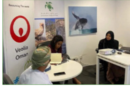
مسابقة نمط للمدارس الحكومية

أقيمت الجولة الثانية من مسابقة نمط لجمعية البيئة العمانية في الربع الثاني من هذه السنة. تم اختيار ٨١ مشروعاً من ٢٧٤ مدرسة للمشاركة في مسابقة التوعية البيئية. وانتقلوا إلى المرحلة الثانية من المسابقة، حيث تم تطوير المشاريع المتعلقة بمواضيع إدارة النفايات والمياه والطاقة، وفي شهر مايو، اجتمعت لجنة التحكيم على مدار أسبوعين لمراجعة لجنة المشاريع واختيار ١١ مدرسة للمرحلة النهائية. التقييمات النهائية ستجري في سبتمبر، نود أن نشكر شركة فيوليا ومبادرة حدائق إيميلي لدعمهم المستمر لهذه المبادرة التعليمية العامة.