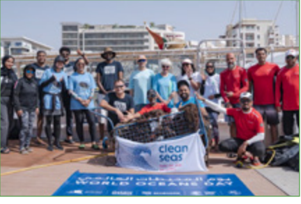
اليوم العالمي للمحيطات

بمناسبة اليوم العالمي للمحيطات، تصافرت جهود جمعية البيئة العمانية مع شركة عمان للإبحار ودي بي سي لشكر عمان لإجراء حملة تنظيف تحت الماء في جزر الديمانيات الأربعة شتات الصيد المحذورة المتشابهة مع الميرجان. تمت إزالة ما يقرب من ٢٠٠ كجم من الشباك أثناء عملية التنظيف، لتيسير التقديرات إلى أنه يتم التخلص في حوالي مليون طن من معدات الصيد في المحط كل عام، مما يؤدي إلى قتل ما يصل إلى ٦٠٠ ألف نوع من الحيوانات البحرية. لمشاهدة جهودنا شاهدوا الفيديو التالي.