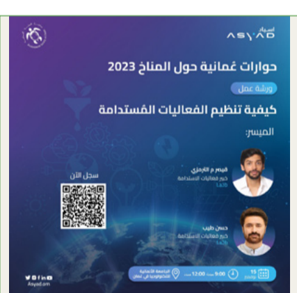
فعالية شهر نوفمبر

نحن فخورون بتقديم برامج العضوية للشركات والأفراد، حيث تقدم للمجتمع العُماني الفرصة لدعم عمل جمعية البيئة العمانية، تقوم بتنظيم محاضرات وفعاليات دورية تُعنى المجال أمام أعضاء الجمعية لتوحيد جهودهم لدعم البيئة، يُمكن التطلع على قائمة الفعاليات القادمة ضمن الموقع الإلكتروني (انظر)، والأطلاع على تسجيلات الأحداث السابقة ضمن قناة الجمعية على اليوتيوب (ESOMediaChannel).