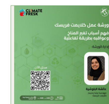
ورشة العمل لأكتوبر