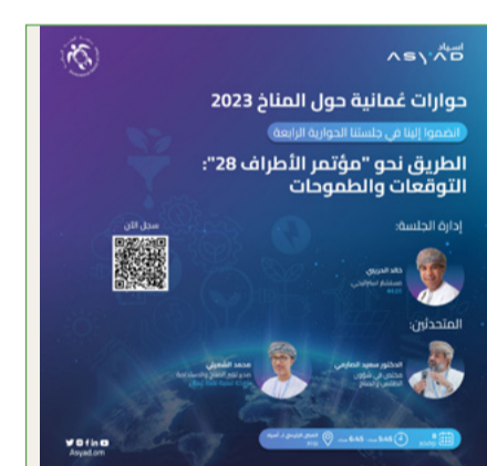
محاضرة شهر نوفمبر