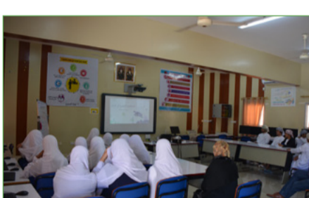
برنامج أبحاث ودراسات الملاحف البحرية وصونها

انتهت هذه الحملة المكثفة بعد تنفيذ نشاطات هامة لتثقيف المجتمع وضمان مشاركته، فقد قمنا بإصدار ونشر مواد التوعية الهامة وهي الرسم البياني حول محمية جزر الديمانيات بالبلعدين البحرية و الانحلطية وأنظمة التنوع الأحيائي ثلاثي العبة ، والتي يُمكن التطلع عليها من خلال زيارة الموقع الإلكتروني للجمعية. شملت جهود التوعية والتواصل ضمن هذه الحملة ما يزيد عن 1100 من الأفراد في محافظتي جنوب الشراة ومسقط، والذين يمثلون العديد من شرائح المجتمع مثل المدارس وجمعيات المرأة ومكاتب الولاية والصيدان وملااب الجامعات. وتهدف هذه الحملة إلى نشر الوعي ورفع سويته وزيادة التقدير للتنوع الأحيائي المميز والأهمية البيئية العالمية لمحمية جزر الديمانيات الطبيعية.