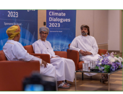
اختتام الجلسات النقاشية للحوارات العمانية حول المناخ

شهد شهر نوفمبر اختتام الجلسات النقاشية للحوارات العمانية حول المناخ، وهي مبادرة جرى تنظيمها بالتعاون مع باين جمعية البيئة العمانية وجمعية أسيايد، وقد تضمنت الحوارات 4 جلسات نقاشية تقاسمية مستوحاة من مؤتمرات الأطراف الثامن والعشرون والمؤتمرات حول المناخ بهدف تعزيز أوجه التعاون والمعرفة حول المناخ بين كافة شرائح المجتمع العمانية، وبفضل التوجيه من الخبراء المحليين والعولبيين، فقد حاولت الجلسات استكشاف ماهية الاستجابة المجتمعية للتغيرات المناخية العالمية، مع انتهاء سلسلة الحوارات، فقد بدأنا المرحلة الثانية من المشروع وهي ورش العمل، حيث تمحورت الورشة الأولى حول كيفية تنظيم الفعاليات المستدامة، وتعزيز التعاون بين القطاعين، وتبادل المعرفة، ومن المقرر تنظيم ورش عمل إضافية خلال عام 2024، وإتاحة المزيد من فرص ومجالات التعليم والتدريب. وفي هذا الإطار فإننا نبرهن عميق امتناننا لمجموعة أسيايد لدعمهم القيم وتمكين الجمعية من تنفيذ هذه المبادرة.