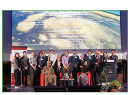
محاضرة التراث الطبيعي العُماني - لندن، المملكة المتحدة

شهد شهر نوفمبر اختتام الجلسات النقاشية للحوارات العمانية حول المناخ، وهي مبادرة جرى تنظيمها بالتعاون مع باين جمعية البيئة العمانية وجمعية أسيايد، وقد تضمنت الحوارات 4 جلسات نقاشية تقاسمية مستوحاة من مؤتمرات الأطراف الثامن والعشرون والمؤتمرات حول المناخ بهدف تعزيز أوجه التعاون والمعرفة حول المناخ بين كافة شرائح المجتمع العمانية، وبفضل التوجيه من الخبراء المحليين والعولبيين، فقد حاولت الجلسات استكشاف ماهية الاستجابة المجتمعية للتغيرات المناخية العالمية، مع انتهاء سلسلة الحوارات، فقد بدأنا المرحلة الثانية من المشروع وهي ورش العمل، حيث تمحورت الورشة الأولى حول كيفية تنظيم الفعاليات المستدامة، وتعزيز التعاون بين القطاعين، وتبادل المعرفة، ومن المقرر تنظيم ورش عمل إضافية خلال عام 2024، وإتاحة المزيد من فرص ومجالات التعليم والتدريب. وفي هذا الإطار فإننا نبرهن عميق امتناننا لمجموعة أسيايد لدعمهم القيم وتمكين الجمعية من تنفيذ هذه المبادرة.