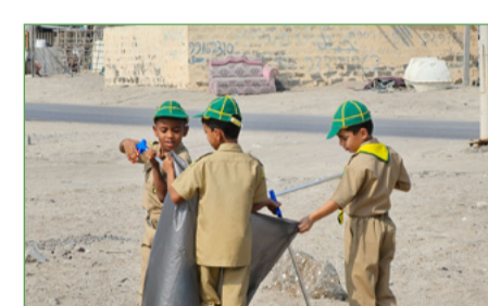
حملة التوعية حول البلاستيك

تضمن هذا البرنامج المستمر تنفيذ مسوحات رصد حالة الجنوح على شواطئ جزيرة صميرة، كما تضمن إصدار ونشر رسم بياني عن المعلومات عن الملاحف العُشبية في جزيرة صميرة، وهو شتاج للفتن البحرية و الانحلطية على الموقع الإلكتروني للجمعية، وذلك بهدف نشر الوعي ورفع السويته، ونحن حالياً نقوم بإعداد وتصميم كتيب شامل عن الملاحف البحرية في عُمان، وفي نفس الوقت نخطط للمراحل القادمة لمسوحات التعشيب لسلاحف ريدل الزرنيوية وسلاحف الشراة في في صميرة خلال شهر فبراير 2024. إضافة إلى ذلك فقد أطلقت الجمعية حملة وطنية للتوعية حول الملاحف البحرية في عُمان، والتي شملت حوالي 2005 من الطلاب بولاية وجمعيات 63 مدرسة حكومية، وشملت أكثر من 100 من جبهاء المجتمع ضمن عدة محافظات (الوسطى وجنوب الشرقية وطفار)، والذين يمثلون شرائح مختلفة مثل الصيادين ومكاتب الولاية وجمعيات المرأة المتألفة، والذين تصافرت جهودهم معاً من أجل صون هذه الثروة الوطنية الهامة.