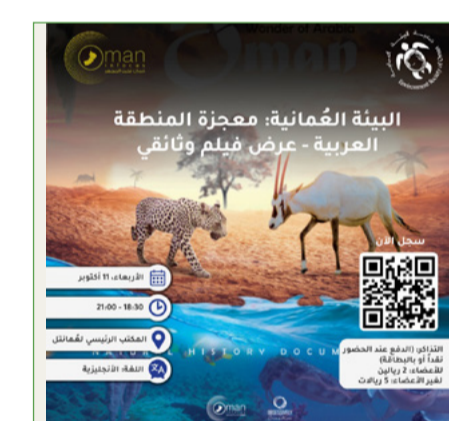
أسبوع الأفلام في أكتوبر

ضمن سلسلة الحوارات العمانية حول المناخ، التي نظمتها الجمعية بتعاون مع مجموعة أسيايد، فقد جرى تنظيم ورشة العمل الأولى والتي كانت بعنوان: «كيفية تنظيم الفعاليات المستدامة»، ويتسبى من خبرات الجمعية والفاضل قيصر ترميزي، والتي كانت بداية المرحلة الثانية من هذه السلسلة. بعد استشارة المحدثين الاقتصادي العالمي، تم إعداد جدول أعمال الورشة التي يركز على أهمية تنظيم الفعاليات المستدامة وتقديم التوصيات حول أفضل السبل للتخطيط والتنفيذ. نعتز عن شركنا العميق لمنسق الورشة المتفاني، معنا، وللجامعة الألمانية للتكنولوجيا في عُمان لاستضافة الفعالية، وللمؤسسي الاقتصادي العالمي.