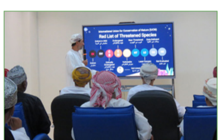
حملة التوعية حول محمية جزر الديمانيات الطبيعية

حرصت جمعية البيئة العمانية على أن يكون لها دوراً فعالاً في المسوحات والشركات الياقة إلى زيادة جهود صون البيئة البحرية، وفي هذا السياق شاركنا في المسوحات التي نظمتها هيئة البيئة في ولاية صرّاب، والتي نجحت بتثبيت أجهزة التتبع عبر الأقمار الاصطناعية وأجهزة تتبع السلوكيات عبر حيتان بحر العرب الحدياء، استمرت هذه الحملة لمدة 11 يوماً، وتضمنت 10 من حيتان بحر العرب الحدياء، وبأني هذا التعاون ما بين هيئة البيئة في عُمان وجمعية البيئة العمانية، وشركة بحار المستقبل، ومنظمة تحالف المحيطات، وجامعة أرويس، من أجل فهم سلوكيات وتحركات وتوجهات هذه الفصيلة من الحيتان المهددة بالانقراض، بغية تحديد أفضل جهود الصون المستقبلي، كما شاركت الجمعية في المسوحات البحرية، وذلك في إطار حرص الجمعية على المساهمة الفاعلة في أي جهود وطنية لصون البيئة البحرية.