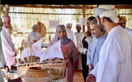
مسابقة نمط للمدارس الحكومية

قام فريق الجمعية خلال شهر أبريل من هذا العام بتنفيذ مسوحات ميدانية في جزيرة مصيرة لمراقبة ورصد تواجد طيور الرخمة المصرية في الجزيرة وحالات تكاثرها وتحديد المخاطر التي تتعرض لها كان المسح الأخير الذي جرى ليداه الطيور في عام ٢٠١٢، والذي بين وجود ٥٢ منقطة مأهولة بأزواج الطيور، وهو ما يُعتبر أحد أعلى الكثافات في العالم، واليوم وبعد ١١ عاماً، تقوم بإجراء نفس المسوحات لمعرفة توجهات الكائن للطيور، وما زالت البيانات المجمعة من المسوحات قيد التحليل والدراسة. تقدم بالشكر لصندوق دولتي للصون لتمويل هذه المسوحات، ولهيئة البيئة لدعمهم المتواصل لهذا المشروع.