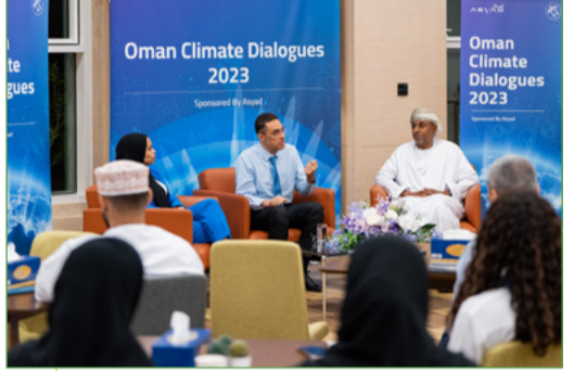
Oman Climate Dialogues 2023

أطلقت جمعية البيئة العمانية في شهر مايو سلسلة الحوارات العمانية حول المناخ، وذلك بالتعاون مع مجموعة أسبأد، وهي مبادرة تهدف إلى تعزيز العمل المناخي وتدعيمه ضمن وبن كافة فئات المجتمع العُماني، ومن خلال الدعم الذي تلقاه المبادرة من الخبراء المحليين والدوليين لقيادة النقاشات والحوارات وورش العمل، فهي تُشكل فرصة للجمع للتعرف على الجهود التي تقوم بها سلطنة عُمان للتعامل مع هذه التحديات العالمية. لمعرفة المزيد والاطلاع الرجاء زيارة الموقع https://www.eso.org.om/oman-climate-change-dialogues شاركوا ضمن النقاشات، فمناخنا يستحق ذلك.