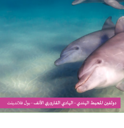
دولفين المحيط الهندي، الهادي القافز الأبيض، دول لالابيت

شهد شهر أبريل تنظيم محاضرة للدكتور سلفادور كارانزا، وهو أستاذ باحث ومدير معهد علم الأحياء التطوري، برشلونة - إسبانيا، وكانت المحاضرة بعنوان «الزواحف في عُمان»، والتي استعرضت عدداً من أنواع الزواحف المتوطنة في سلطنة عُمان، مع التركيز على بعض المجموعات التي يتم التحقق منها حالياً، والتي قد ينتج عنها تسجيل بعض الأنواع الجديدة.