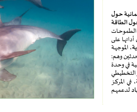
دولفين المحيط الهندي، الهادي القافز الأبيض، دول لالابيت