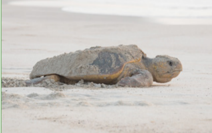
برنامج دراسات السلاحف البحرية وصونها

بمناسبة اليوم العالمي للمحيطات فقد تصافت جهود جمعية البيئة العمانية وعمان للإبحار وهيئة البيئة بهدف تنظيم حملة تنظيف تحت الماء في مصيبة جزر اليمانيات بغية إزالة شباك الصيد المملة المتشابكة مع الشعب المرجانية. يقدر حجم شباك الصيد التي تقفد وتضيع في أعماق المحيطات بمليون طن سنوياً، وهي تعمل على قتل حوالي ٦٥٠ ألف حيوان من الأنواع المهددة بالانقراض في المحيطات. في الحملة بإزالة حوالي ٢٠٠ كجم من الشباك، وتمكن الأطلاق على فيديو قصير لجهودهم من خلال زيارة قناة جمعية البيئة العمانية على اليوتيوب (ESOMediaChannel).