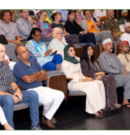
أهمية سينمائية لجمع التبرعات - عُمان الفطرية: العجائب العربية

بمناسبة اليوم العالمي للتنوع البيئي فقد نظمت جمعية البيئة العمانية خلال شهر مايو فعالية لجمع حصري للفيلم الوثائقي عُمان الفطرية: العجائب العربية، وهو الأول من نوعه من الأفلام الوثائقية التي تسلط الضوء على الحياة الفطرية العمانية. تقدم الجمعية بجزيل الشكر لفريق عُمان تحت المهر لإتاحة الفرصة للجمعية لعرض الفيلم، والشكر أيضاً لشركة عُمانتل لاستضافة الفعالية.