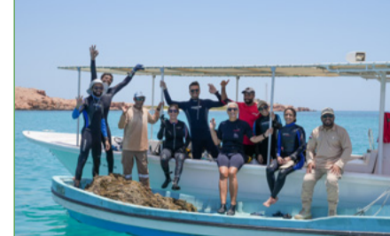
اليوم العالمي للمحيطات

بمناسبة اليوم العالمي للمحيطات فقد تصافت جهود جمعية البيئة العمانية وعمان للإبحار وهيئة البيئة بهدف تنظيم حملة تنظيف تحت الماء في مصيبة جزر اليمانيات بغية إزالة شباك الصيد المملة المتشابكة مع الشعب المرجانية. يقدر حجم شباك الصيد التي تقفد وتضيع في أعماق المحيطات بمليون طن سنوياً، وهي تعمل على قتل حوالي ٦٥٠ ألف حيوان من الأنواع المهددة بالانقراض في المحيطات. في الحملة بإزالة حوالي ٢٠٠ كجم من الشباك، وتمكن الأطلاق على فيديو قصير لجهودهم من خلال زيارة قناة جمعية البيئة العمانية على اليوتيوب (ESOMediaChannel).