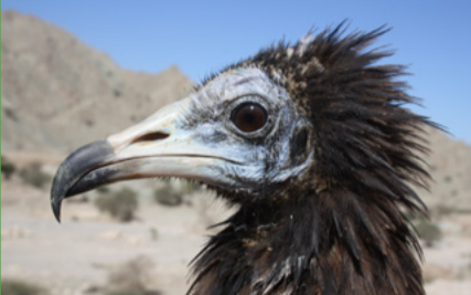
المسوحات الميدانية لطيور الجارحة

بدأ مشروع الجمعية لدراسات السلاحف البحرية وصونها في عام ٢٠٠٨، وهو مستمر هذا العام حيث انطلقت الأعمال الميدانية مع بداية شهر مايو بهدف مراقبة ورصد ما تنزح إليه السلاحف المعششة، وتطبيق إجراءات وتدبير الصون اللازمة لهذه الفصيلة الفرعية المهددة بالانقراض من سلاحف شمال المحيط الهندي الريمانية (Caretta caretta) المعششة في عُمان. ونود التقدير بالشكر لكل من هيئة البيئة وصندوق السلاحف البحرية التابع للإدارة الأمريكية لخدمات الثروة السمكية والحياة الفطرية، وشبكة بيئة المحيطات، وسعادة والي مصيرة، وشركة بحار المستقبل، لكل ما قدموه من دعم لأعمال الجمعية.