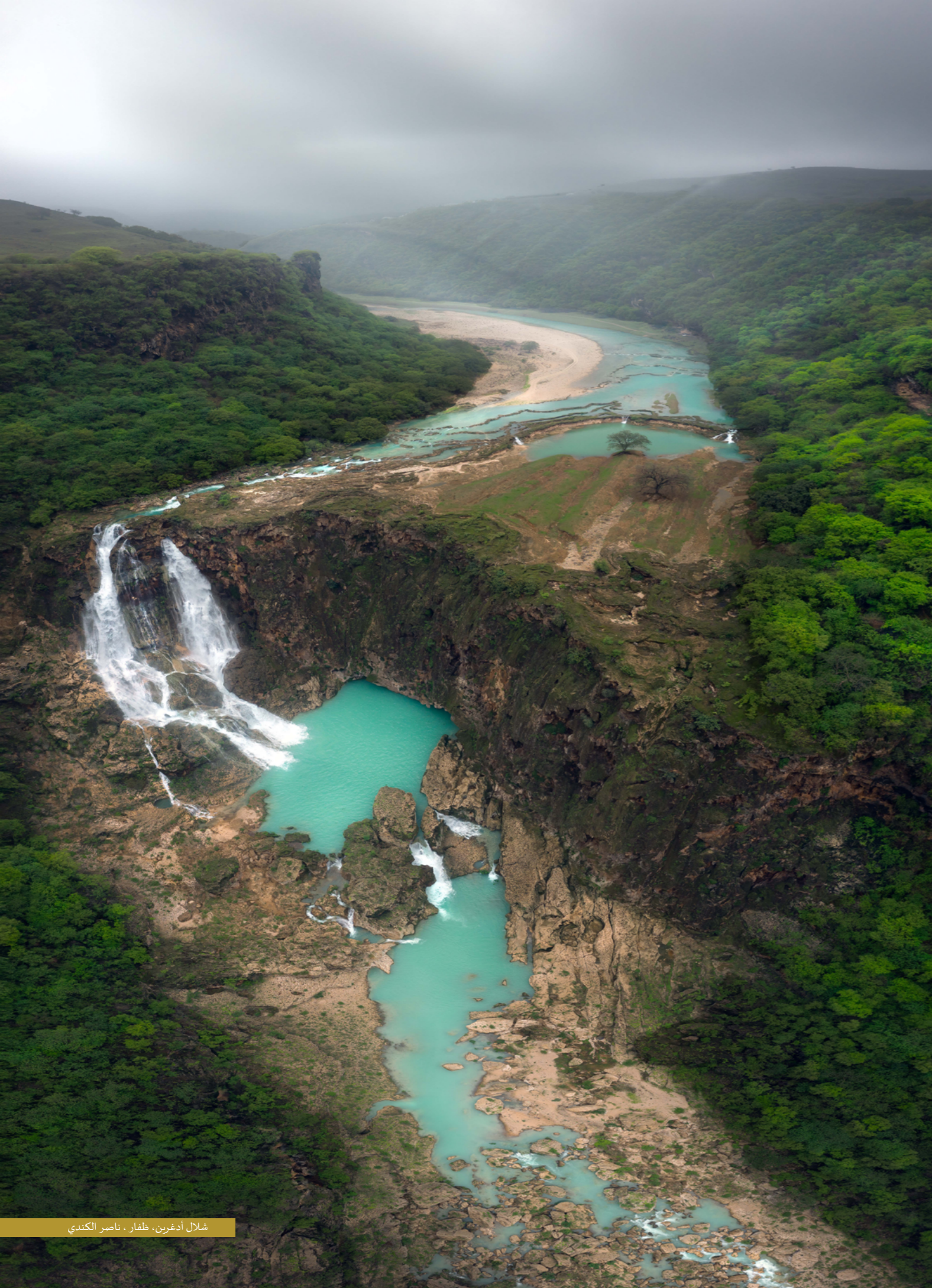
شلال أدغرين، ظفار، ناصر الكندي