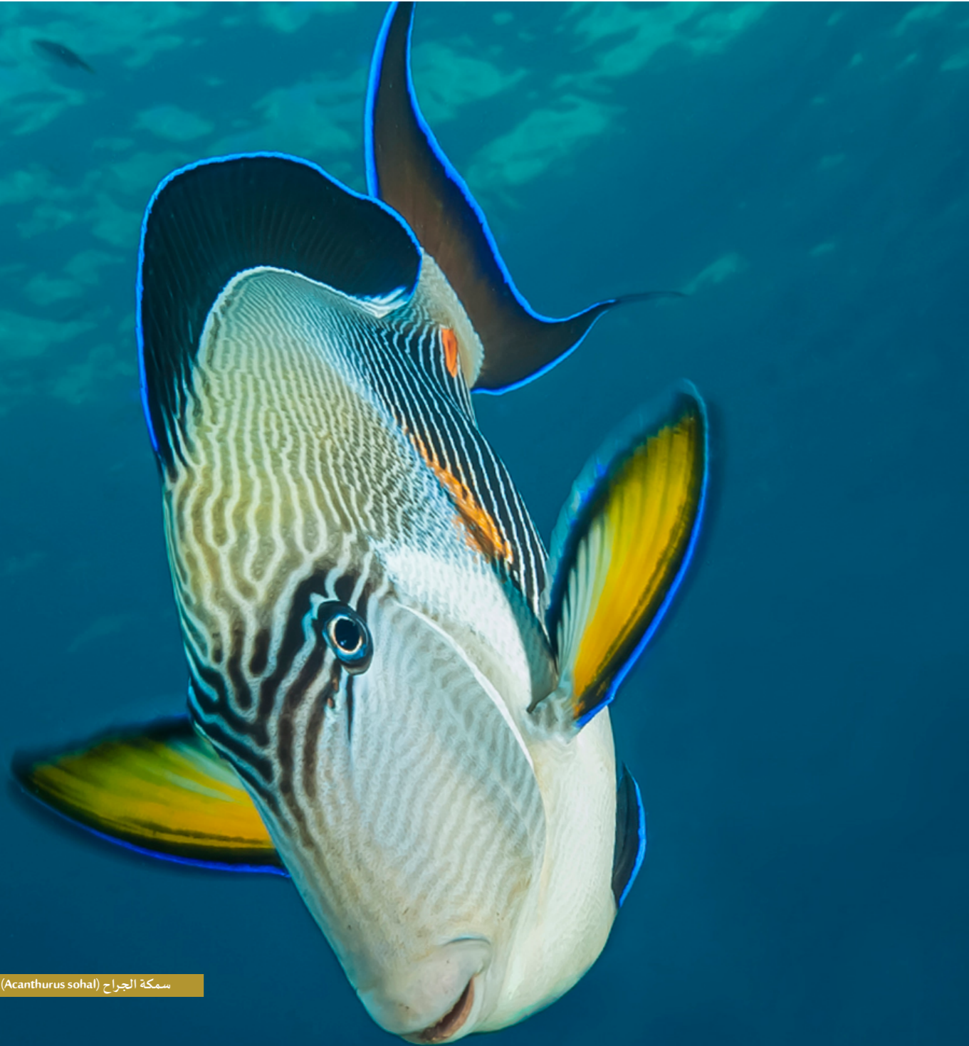
سمكة الجراح (Acanthurus sohal)، بول فلاندينيت

استضافت الجمعية بفخر النسخة الرابعة عشرة من حفل العشاء الخيري بدعم من "شل عُمان" بصفة الراعي اللؤلؤي، والرعاة المرصنين "أومينفست"، و"الجنبي العالمية للسيارات"، و"ألغا فيش". كما تم تلقي رعاية إضافية من شركة "٤٤,٠١". جمع هذا الحدث أكثر من ٢٠٠ من قادة الشركات ورواد الأعمال وأصدقاء الجمعية الذين يشاركوننا الشغف لإحداث تأثير ملموس في القضايا البيئية. احتفل الحفل بإرث الجمعية الممتد لعشرين عاماً من الإنجازات في مجالات التعليم والتوعية وصون البيئة. ويمتد امتناننا القلبي لكل من ساهم في نجاح الحفل من رعاية ومتبرعين والمساهمين في الميزان والداعمين العينيين: "الألحان"، و"موزاييك للفعاليات"، و"تاول تيك للحلول"، و"أفريكان أند إيسترن".