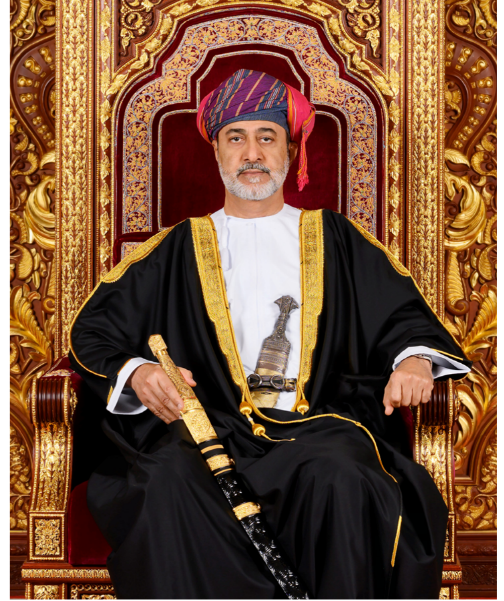
صاحب الجلالة السلطان هيثم بن طارق حفظه الله ورعاه