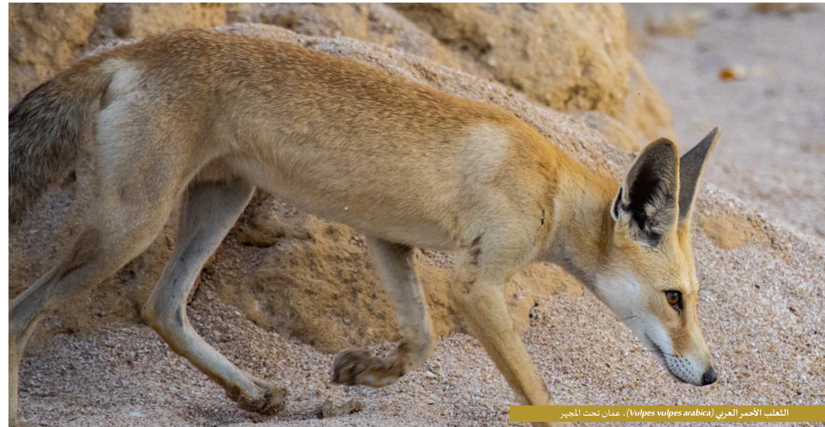
الثعلب الأحمر العربي (Vulpes vulpes arabica)، عمان تحت المجهر

تعد عضوية الشركات بوابة قيمة لتعزيز الروابط والتعاون مع شركائنا، ونحن ملتزمون باستمرار بتحسين وإضافة القيمة والمزايا لهذه العضوية. وإلى جانب التقدير الذي تحصل عليه الشركات كأعضاء، تشمل المزايا الأخرى توفير إرشادات محددة لتعزيز ممارسات المكاتب المستدامة، وتنظيم فعاليات صديقة للبيئة، وتسهيل مبادرات التنظيف الخاصة بالشركات. كما نشجع الحملات المشتركة لدعم القضايا البيئية ونتطلع إلى إطلاق المزيد من المبادرات التي تعزز هذا التعاون. عقدت الجمعية خلال هذا العام شراكة مع "فيفتي شيدز جرينز" التي سوف تتبرع مجاناً للأعضاء بدورة تدريبية مدتها 90 دقيقة حول التوعية بالاستدامة، وتعطي أيضاً سعراً مُخفضاً لبرامج التدريب على كيفية إعداد تقارير الاستدامة والحوكمة والبيئة والمجتمع والعمل المؤسسي.