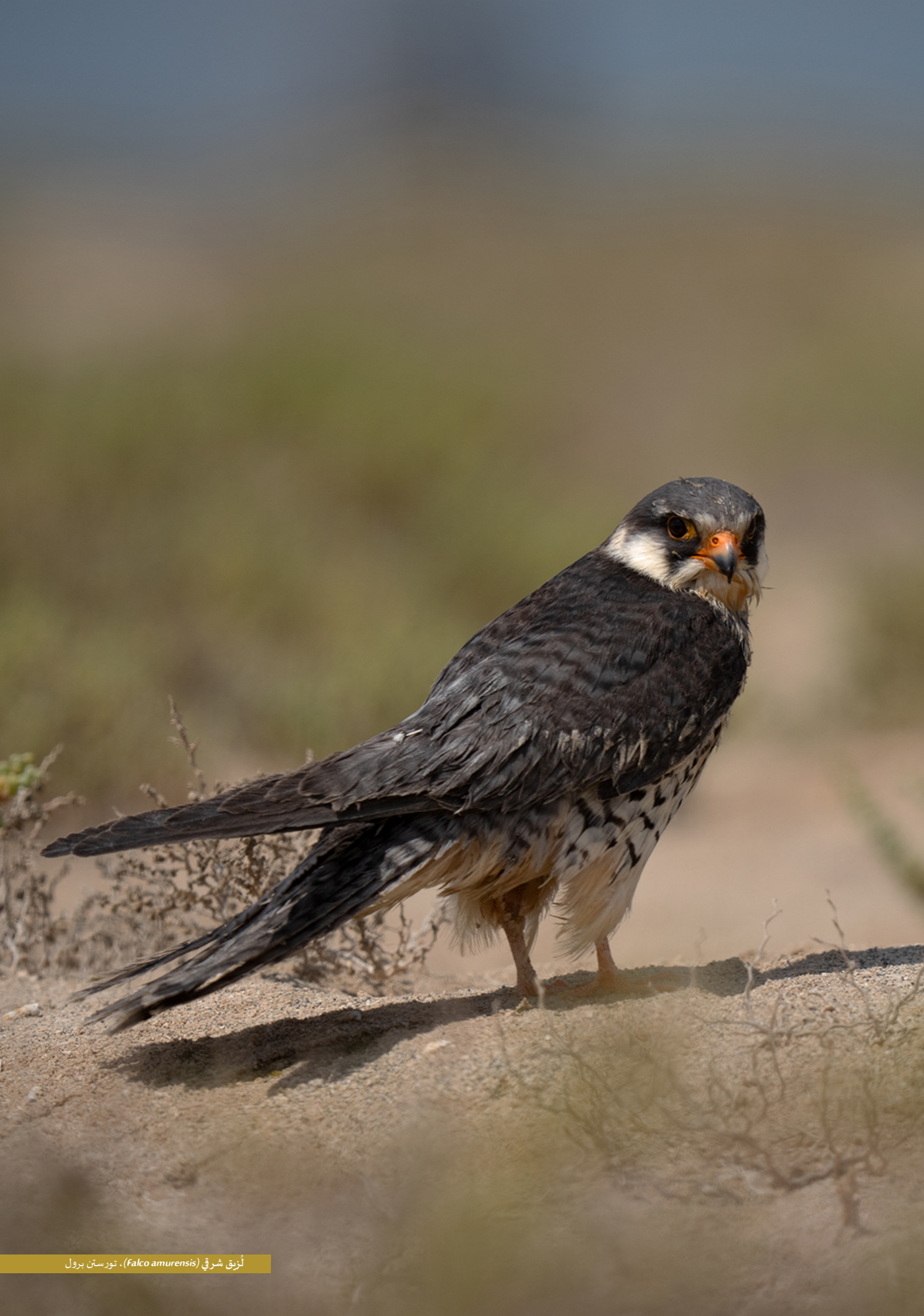
لُنزق شرقي (Falco amurensis)، تورستن برول